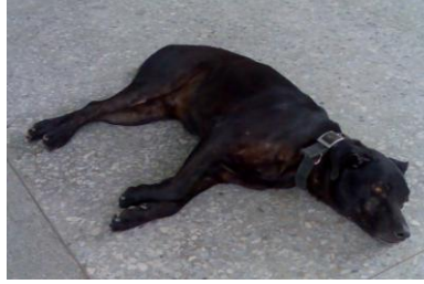
黑狗兄 (公, 已紮)