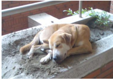
白臉 (公, 未結紮)