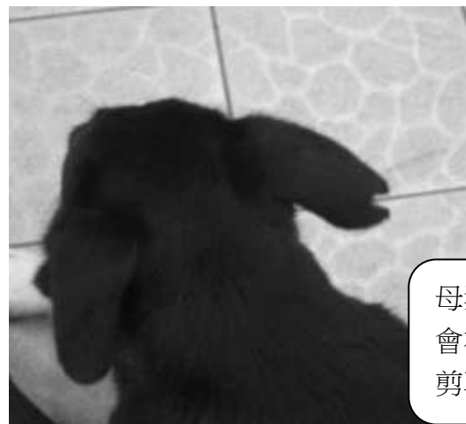
母狗結紮 會在右耳 剪耳。

*校園內犬隻除了因年紀過大，在結紮麻醉的過程中會有死亡的風險，其餘犬隻皆已由志工隊、過去旺旺社、台南動物保護的民間團體協助結紮。