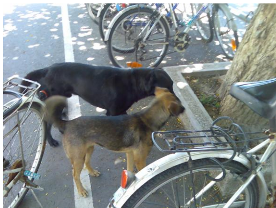
黑狗是老黑，棕狗是新的未結紮母狗

6/9 發現未結紮八個月大母狗，立即帶去佳諾動物醫院結紮，術後照顧數日確保腹部傷口完全癒合再原地放回。(去年體質較特殊的狗曾發生腹部開刀傷口破裂)