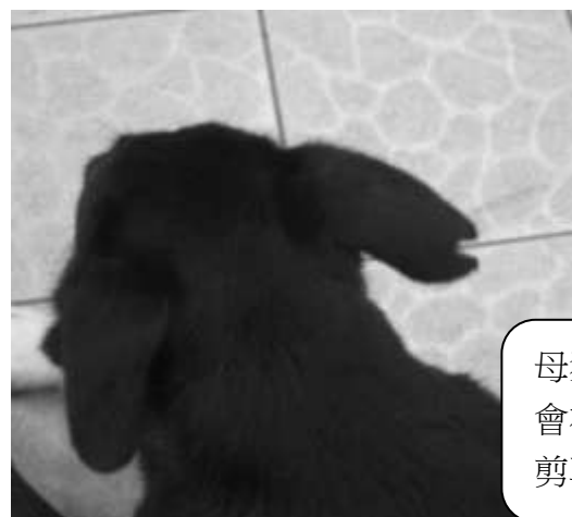
母狗結紮 會在右耳 剪耳。

*校園內犬隻除了因年紀過大，在結紮麻醉的過程中會有死亡的風險，其餘犬隻皆已由志工隊、過去旺旺社、台南動物保護的民間團體協助結紮。