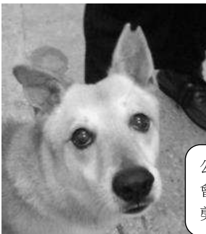
公狗結紮 會在左耳 剪耳。