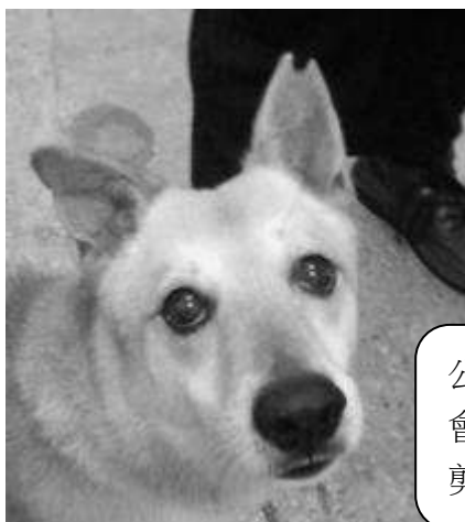
公狗結紮 會在左耳 剪耳。