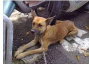
母犬、立耳、體型瘦弱、未結紮、13公斤