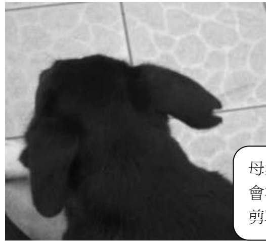
母狗結紮 會在右耳 剪耳。

*校園內犬隻除了因年紀過大，在結紮麻醉的過程中會有死亡的風險，其餘犬隻皆已由志工隊、過去旺旺社、台南動物保護的民間團體協助結紮。