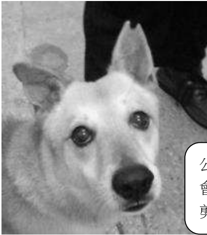
公狗結紮 會在左耳 剪耳。