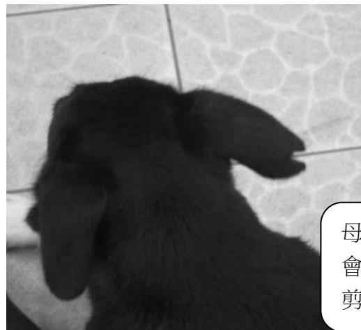
母狗結紮 會在右耳 剪耳。

*校園內犬隻除了因年紀過大，在結紮麻醉的過程中會有死亡的風險，其餘犬隻皆已由志工隊、過去旺旺社、台南動物保護的民間團體協助結紮。